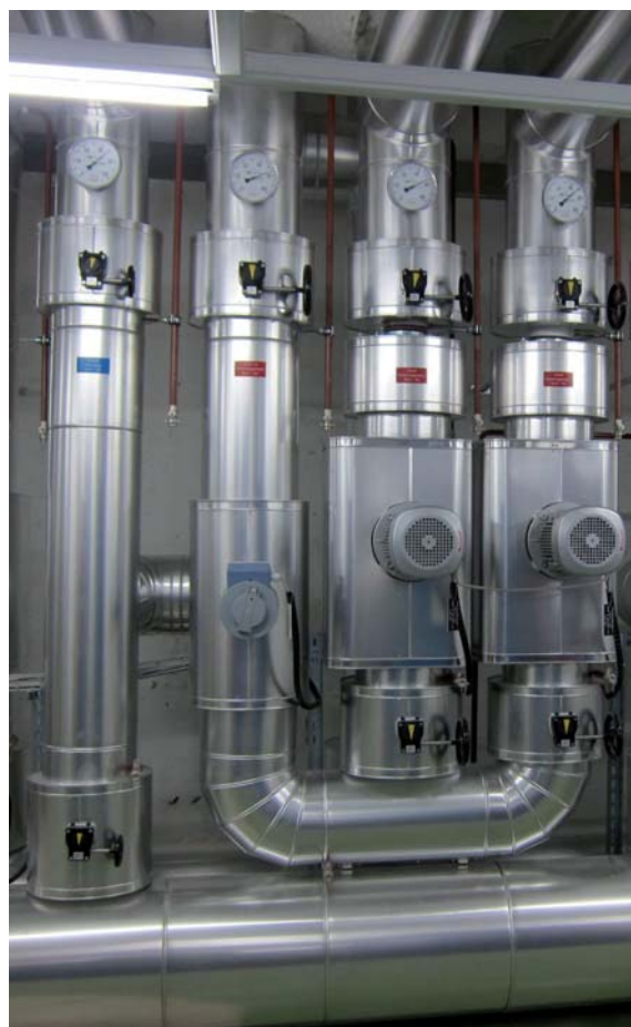
Hydraulik im Heizraum

Der Q-Leitfaden beschreibt den Ablauf von QM Holzheizwerke® und nennt Qualitätsforderungen.